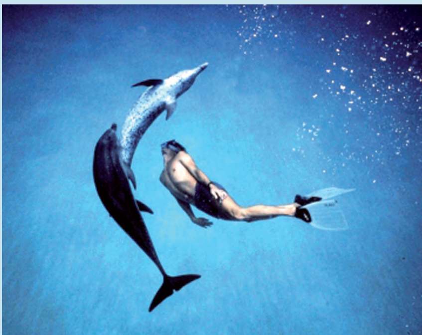
קשר יוצא דופן עם הדולפינים

הסרט הדוקומנטרי "הדולפין" מספר על בחור ערבי בשם ריאד, שאיבד את יכולת התקשורת עם הסביבה. איך זה קרה לז? ריאד בסך הכל שלח sms תמים לאחת מי- דירותיו בבית הספר. אחיה הגדולים ראו את ההודעה והבינו אותה כמסר מיני לא הולם. בלי לחשוב פעמיים הם חטפו את ריאד למ- חסן והיכו אותו מכות רצח במשך כל הלילה. בעקבות ההתעללות הסתגר ריאד בעצמו ואיבד את היכולת לתקשר עם הסביבה. הוריו לקחו אותו לטיפולים שונים, אך כולם היו לשווא.