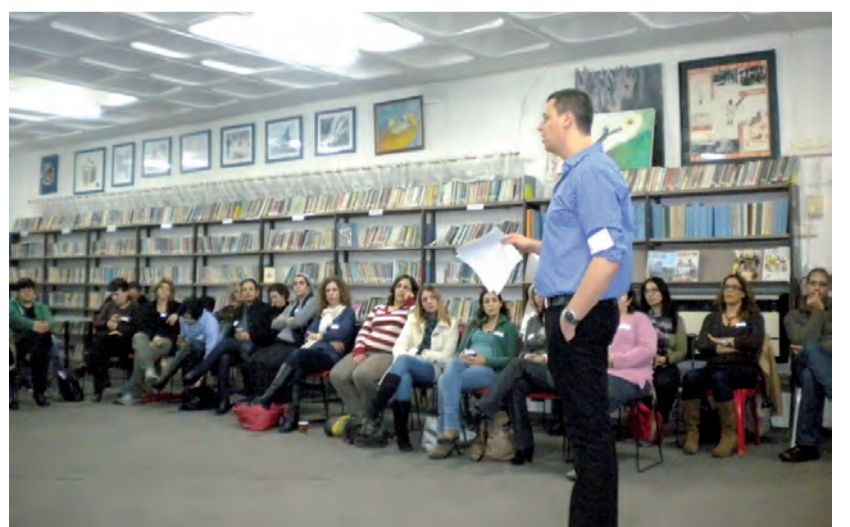
המקום שממנו יוצאת החברה העתידית. תוכנית מארג

כדי ללמד אותם להתנהג בכבוד לסביבת האנשים וכן לסביבה הטבעית (בעלי חיים וצמחים). לחטיבה חשוב שהתלמידים יממשו את הפוטנציאל הטמון בהם ויפתחו כישורים בתחום החברתי והלימודי. ואחרי שמחליטים צריך גם לבצע. שבועיים ימים, משואה לתקומה, חווינו פעילויות הקשורות לאירועים המשמעותיים, בליווי הקשר לחינוך היהודי, ציוני ואזרחי. בשביל הזהות והרעות צעדנו להזדהות עם קורבנות השואה. שיכבה ז' השתתפה בהצגה פעילה "עשר קופסאות גפרורים", שיכבה ח' פעלה בחדר מוזיאון שהוקם אצלנו ושיכבה ט' שמעה הרצאה מפיו של נ"י צול שואה. במסגרת הטיוול הבית ספרי כל שיכבה התמקדה בנושא מסויים במוזיאון החדש ביד ושם. בסוף השנה נחשוף את החזון הבית ספרי ביום מיוחד שבו נצמד בשביל המקום, בשביל הזהות והרעות וב' שותפות עם הקהילה ובאי בית החינוך שז"ר. והדרך עוד ארוכה, אך מעניינת.