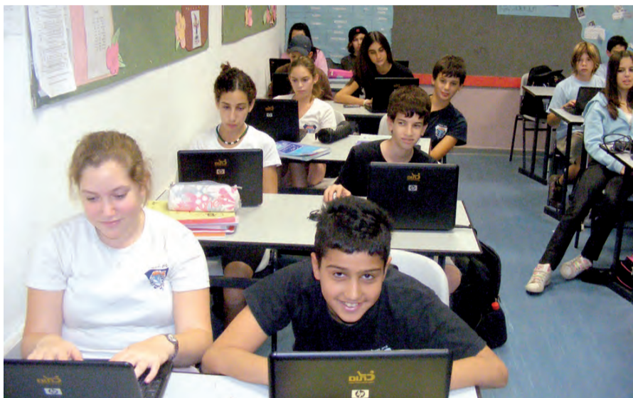
לעבר השתלבות בעולם הטכנולוגי. כיתת כתו"ם

יצנות רפואית, וטרינריה, גני ילדים ועוד - אפשרויות ההתנדבות שלנו במסגרת המחוייבות האישית רבות ומגוונות וכל אחד מוצא בהן את מקומו. חלקנו הפכנו ל"פרחי יומולדת" שחוגגים ימי הולדת לילדים ממשפחות עניות, אחרים עובדים עם בעלי חיים, יש כאלה שמתנדבים במסגרות לבני נוער, יש "אחים גדולים" שעוזרים לילדים צעירים בתחומים שונים. קבוצה אחרת יוצאת לרכיבה בפארק עם ילדים בעלי צרכים מיוחדים,