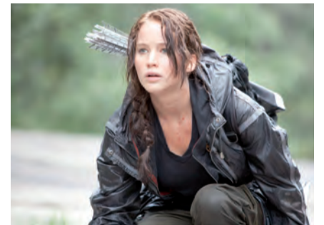
משחקי אכזרי. משחקי הרעב