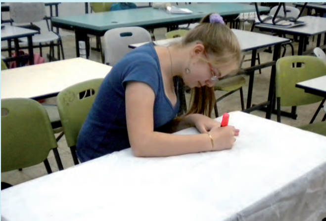
להתייחס בכבוד לציוד

לא נעים לשבת על כיסא הרוס מול שולחן מטונף <<< אם כולנו נתייחס בכבוד לרכוש, נוכל לחיות בסביבה נעימה יותר >>> ויש גם טיפ גאוני