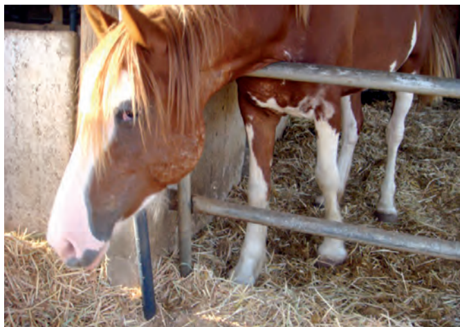
מטפלים בחיות השונות. וטרינרים צעירים