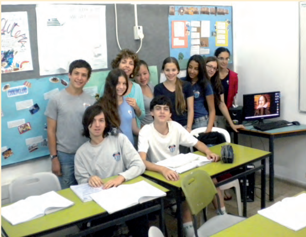
כיתת דוברי אנגלית. שיכבה ט' בליווי של שיקספיר