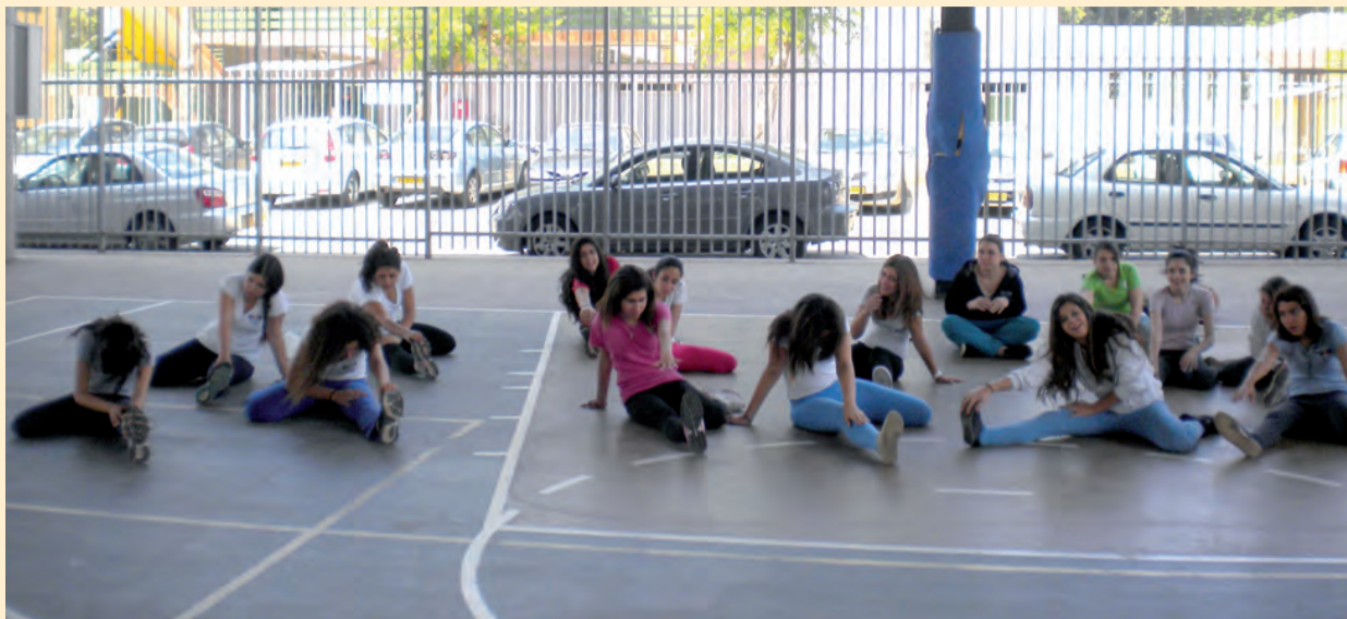
אין בעיה להגיע לרמתם של הבנים. בנות בשיעור ספורט